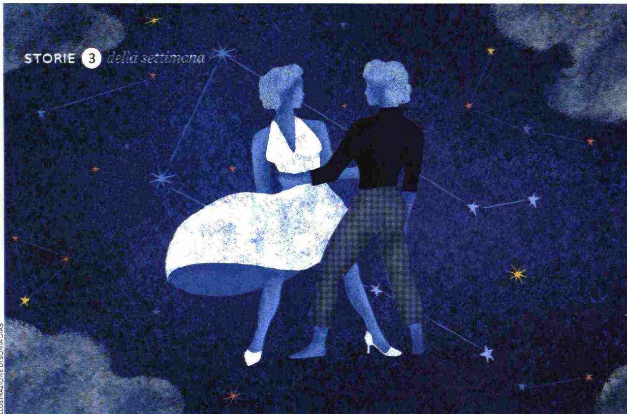
ILLUSTRAZIONE DI SONIA DIAB